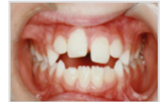
Durante el tratamiento (después de 3 meses)