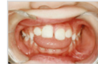
Antes del tratamiento