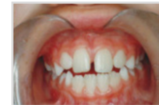
Después del tratamiento